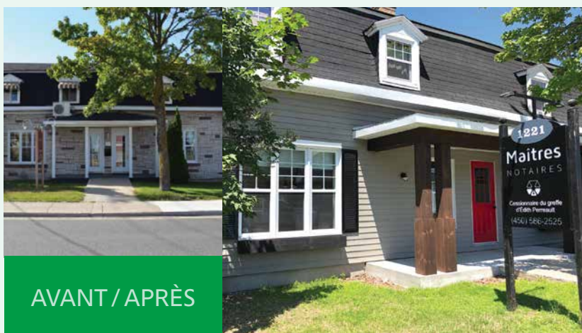
AVANT / APRÈS

275, rue Notre-Dame 450 586-2921, poste 2220 urbanisme@ville.lavaltrie.qc.ca