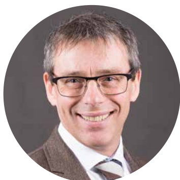
Mot du maire P.2