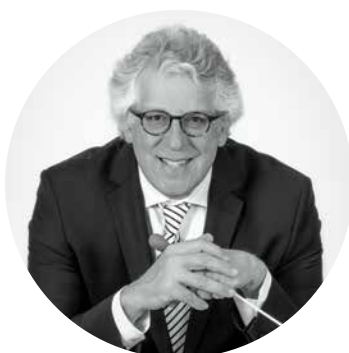
Portrait d'artiste P.4