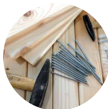
Rappels saisonniers P.6